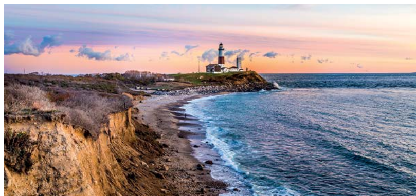
Widok na Atlantyk na jednej z plaż Long Island

♥ Podróż w czasie – odkrywanie codziennego życia XIX-wiecznych mieszkańców amerykańskich wsi w Genesee Country Village and Museum niedaleko Rochester. Możliwość spędzenia nocy... bez prądu i bieżącej wody. Dla amatorów przygód Zob. s. 141.